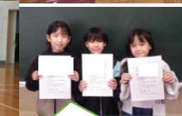
読書をたくさんしました😊